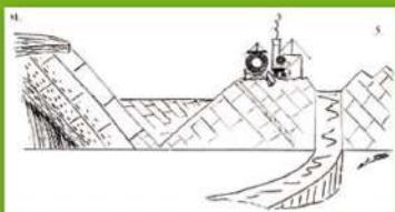
Exploitation de la carrière. Schéma E. Bolelli, 1951

La carrière des Landes est donc un site géologique d'un véritable intérêt patrimonial, en plus de son intérêt scientifique et pédagogique.